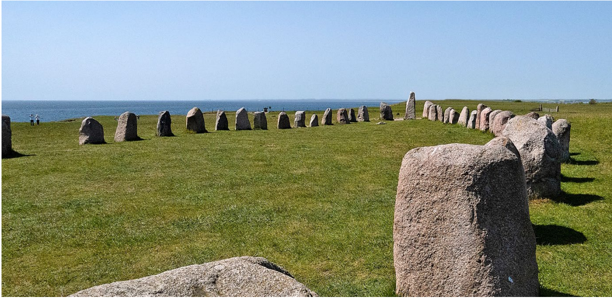
Ales stenar, mäktig miljö. 25 maj. (Magnus Ullman)

God fika i solskenet på uteserveringen Kåseberga nere vid vattnet – här hade man kunnat bli kvar länge!