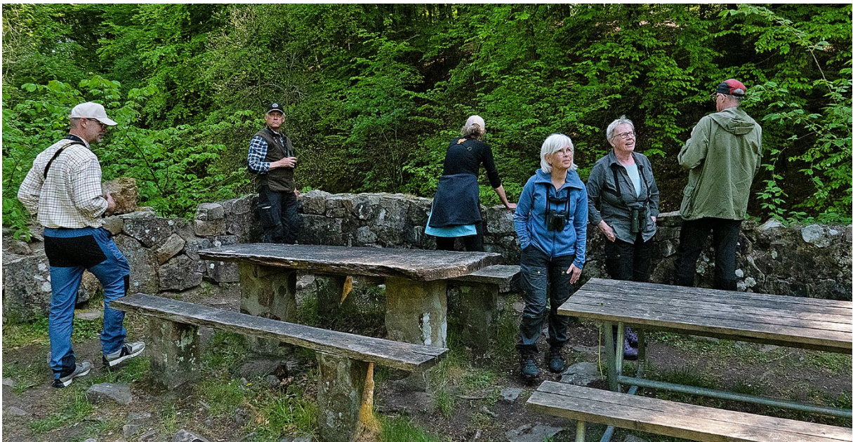
Vi hittar ingen forsärla vid Forsemölla men njuter av den härliga miljön. (Magnus Ullman)

Skön lunch vid bänkarna nedanför hållristningarnas p-plats – betydligt varmare och behagligare väder idag; ”första sommardagen” även om det även sagts redan tidigare.