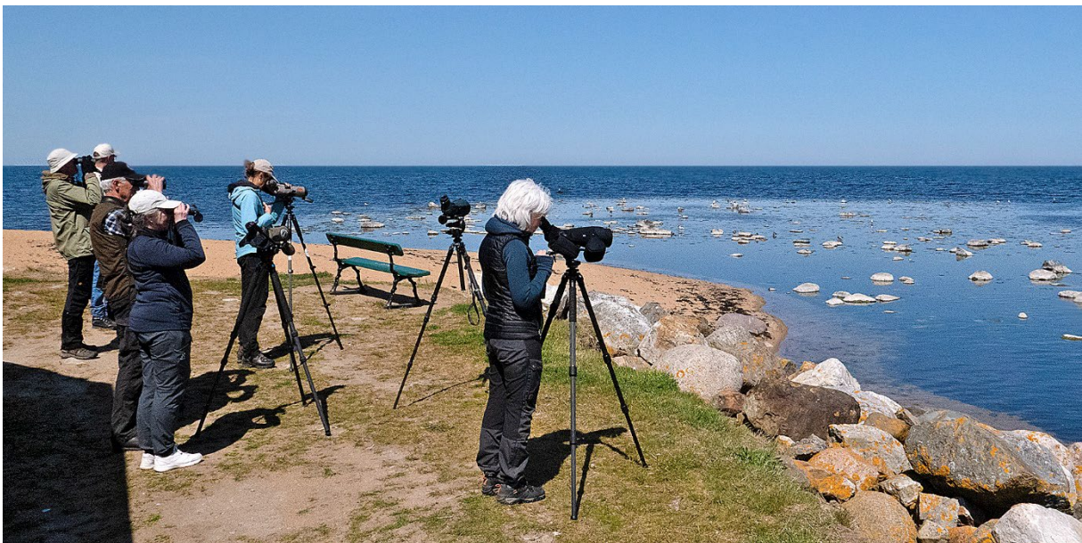
Spaning vid Revet, 23 maj.

Vi fortsätter till Revet strax norr om Tommarpsåns mynning. Inte bara gråtrutar vid Revet, även skedand, bläsand, småskrake och långt, långt ut ejder. Kentska tärnor flyger av och an och visar upp sig fint.