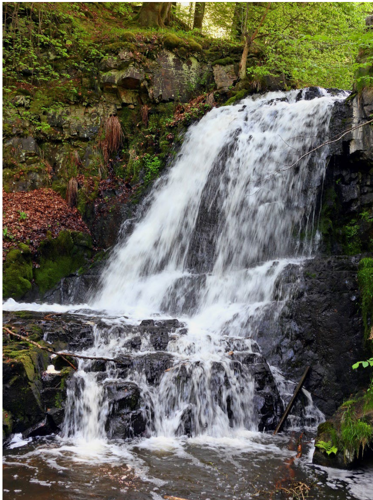
Forsemölla, 24 maj. (Petter Gunnarsson)

2 Glivarpa mosse 22/5, 1 par Lindgrens backar 23/5, 1 Tygeåns mynning 25/5