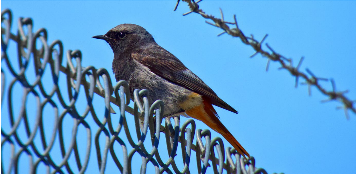
Till slut: en fin adult hane svart rödstjärt. Simrishamns hamn 23 maj.

Vi fortsätter till Revet strax norr om Tommarpsåns mynning. Inte bara gråtrutar vid Revet, även skedand, bläsand, småskrake och långt, långt ut ejder. Kentska tärnor flyger av och an och visar upp sig fint.