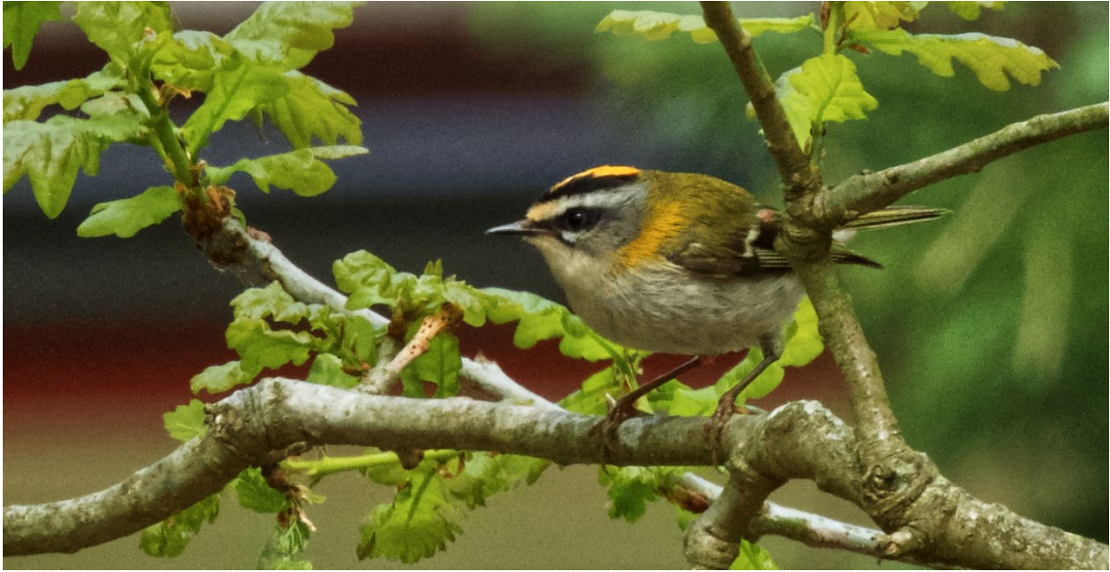
Brandkronad kungsfågel, Löderups strandbad, 25 maj. (Petter Gunnarsson)