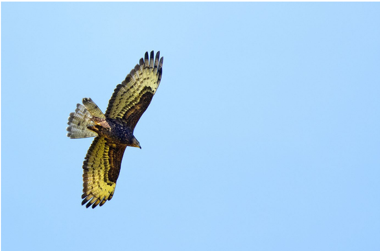
Vi ser flera bivråkar under resan, den första vid Glivarpa mosse den 22 maj. (Magnus Ullman)

Vid Glivarpa mosse är det betydligt mer fågel, bland annat ett par rapphöns som rör sig framför oss hela tiden. Från vassen hörs en sångare – rör- eller sävsångare? Sjunger så slött att man nästan somnar när man lyssnar på den, alltså rör.