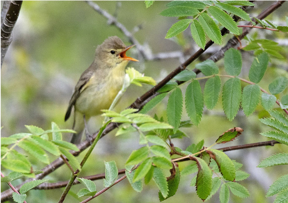
Härmsångare, Norra huvudet, Stenshuvud, 23 maj.