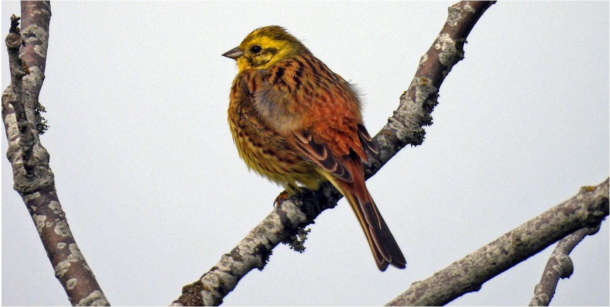
Gulsparv, Norra huvudet, Stenshuvud, 23 maj. (Petter Gunnarsson)