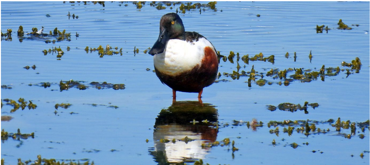
Skedand, Revet, 22 maj. (Petter Gunnarsson)