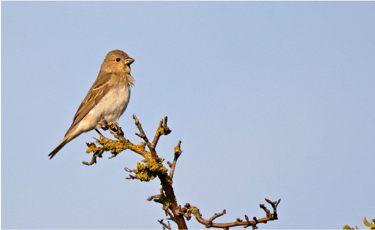
Rosenfink, 2k hanne, Simris strandäng, 24 maj. (Magnus Ullman)