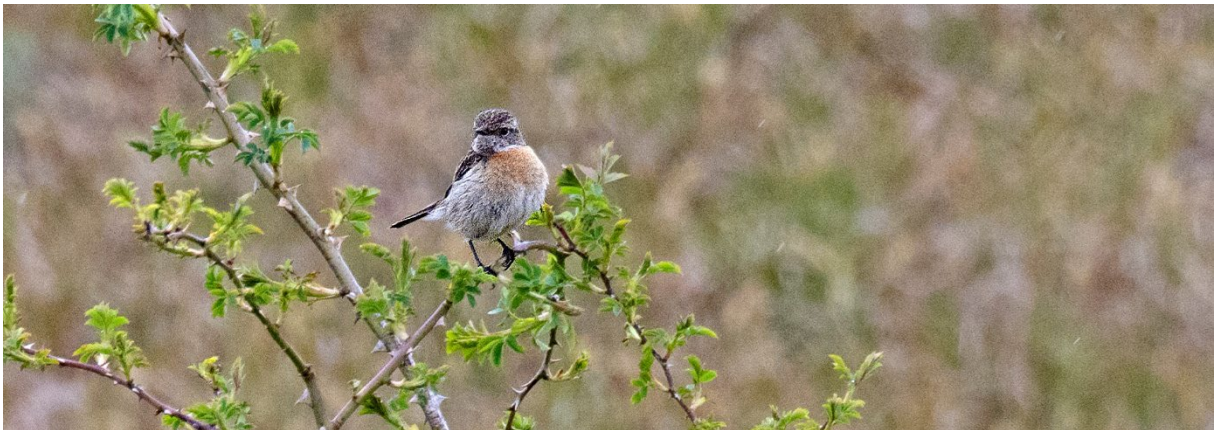
Svarthakad buskskvätta, hona, Lindgrens backar, 23 maj. (Magnus Ullman)