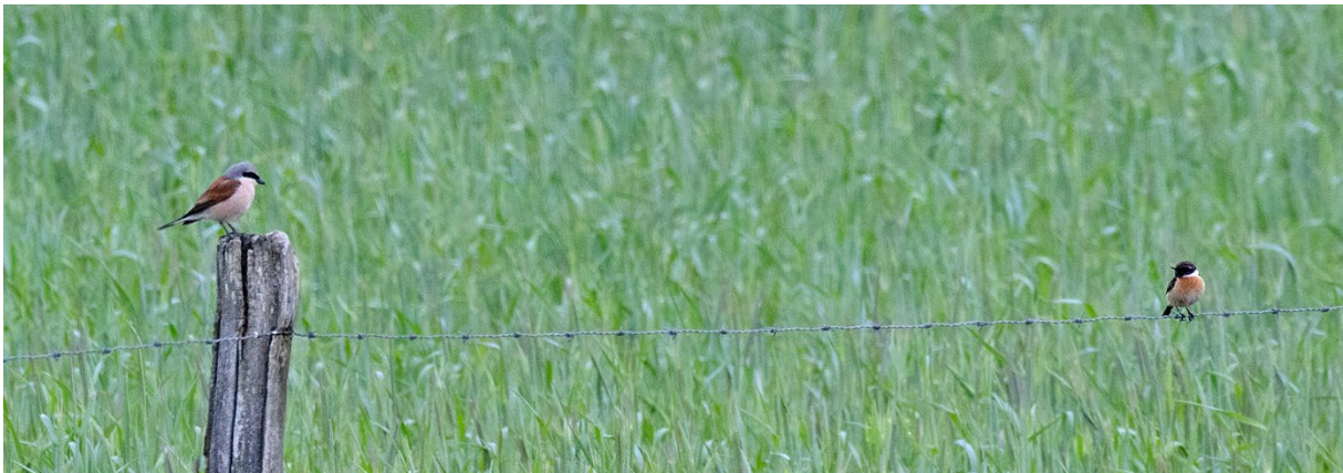
Såväl törnskata som svarthakad buskskvätta vid Lindgrens backar den 23 maj. (Magnus Ullman)

En trädlärka flyger även runt över våra huvuden, och en törnskata bevakar sina jaktmarker från en stängseltråd. Här spatserar också en vit stork från skåneornitologernas storkprojekt.