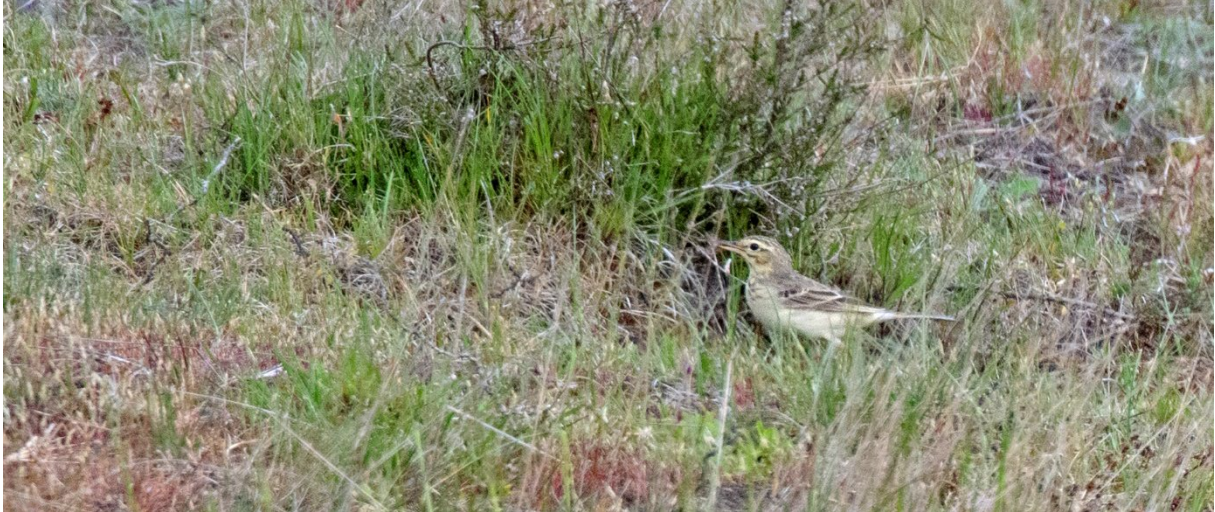
Fältpiplärka i de torra markerna i Drakamöllans naturreservat, 24 maj. (Magnus Ullman)

När vi når det sandiga fältet i Östra Drakamöllans naturreservat får vi tämligen omgående syn på ett par fältpiplärkor som stilla födosöker tillsammans. Numera en av landets avgjort sällsyntast häckfåglar, så det känns nästan heligt att beskåda dessa mysiga fåglar.