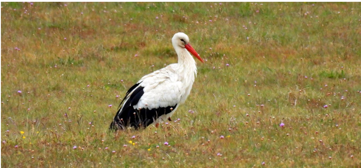
Vit stork, Lindgrens backar, 23 maj. (Petter Gunnarsson)

[Vit stork Ciconia ciconia ] 1 färgmärkt Lindgrens backar 23/5 [inplanterad, ej spontan förekomst, därav hakparentes]