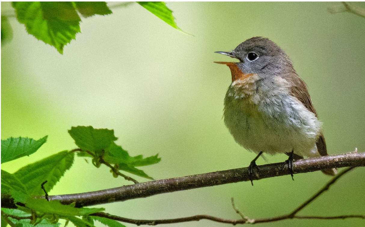
Dagens lunch inleds med sjungande mindre flugsnappare, Hagestads naturreservat, 25 maj. (Magnus Ullman)

Dags för fältlunch i Hagestads naturreservat – som vanligt ståndsmissigt vid bänkar och bord. Men vi har inte ens hunnit sätta oss innan den studsande sången från mindre flugsnappare hörs inne från skogen. Fågeln visar sig dessutom vara en gammal hanne och vi får fina obsar – en revansch för det föga lyckade och något stressiga försöket i måndags. I närheten sjunger även en grönsångare.