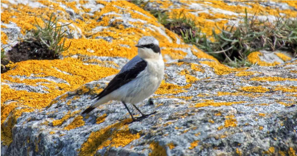
Stenskvätta, 24 maj. (Petter Gunnarsson)