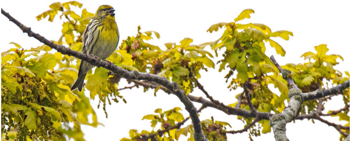
Till slut får vi hygglig kontakt med gulhämpling. Karakås, 23 maj. (Magnus Ullman)

Vi vandrar tillbaka till parkeringsplatsen vid Karakås för en annan av Österlens exklusiva arter, gulhämpling som under en dryg vecka innan vårt besök visat sig flitigt på platsen. Men vi ska grillas! Och får vänta en bra stund på ett substantiellt livstecken, men så småningom får vi fin kontakt med en sjungande fågel. Vi ser 2 ex. flyga tillsammans, och kanske är det totalt 3 exemplar av denna minifink vi observerar.