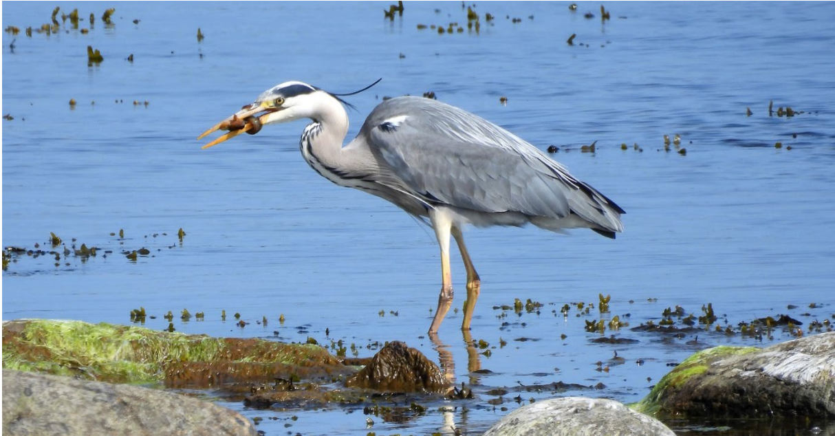
Gråhäger, 26 maj. (Petter Gunnarsson)