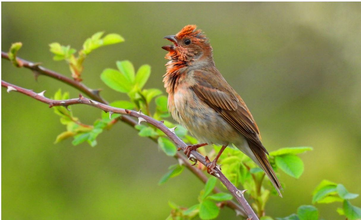
Härliga obsar på rosenfink. Simris strandäng, 26 maj.