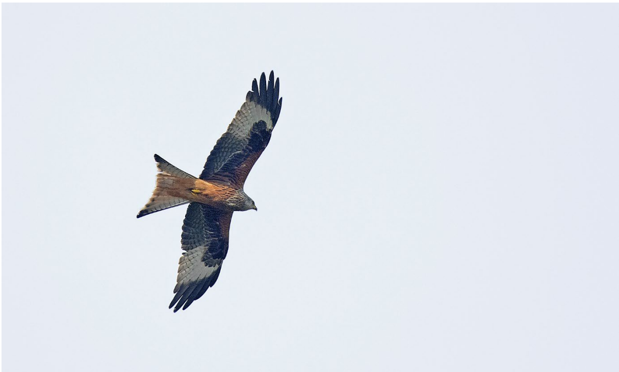
Röd glada, ruggar inte den 22 maj alltså troligen en häckande hanne.