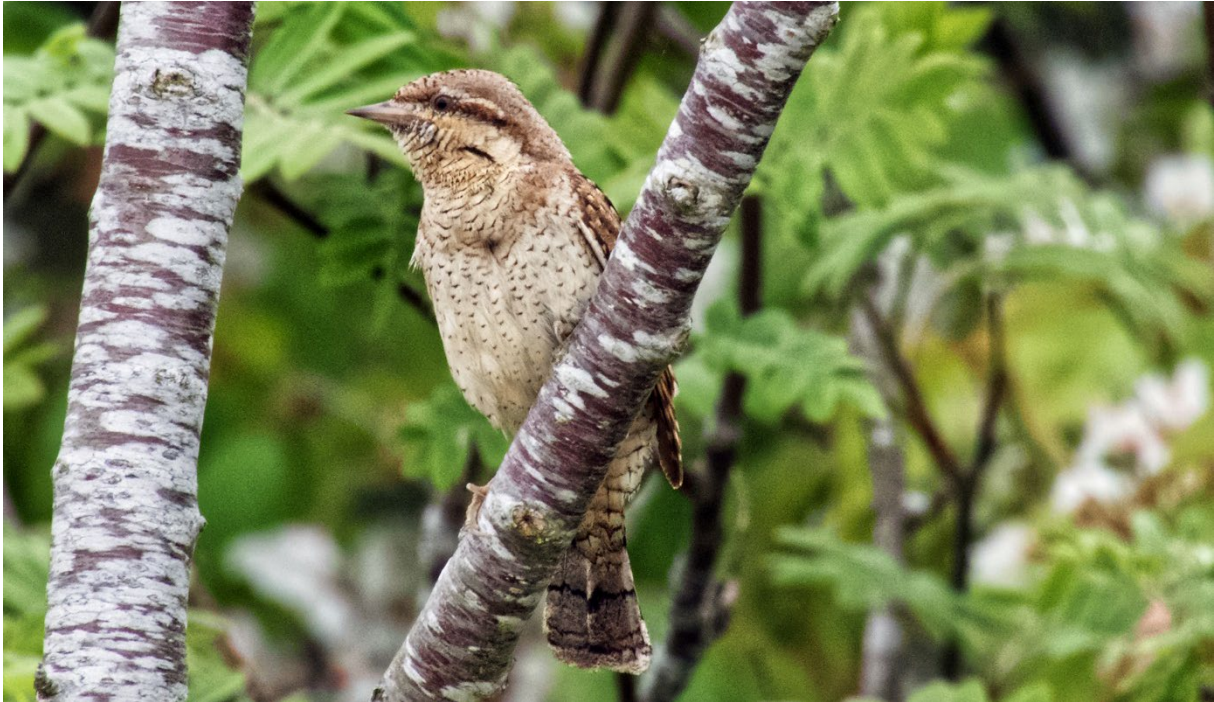
Göktyta, Böljeslagsvägen, 23 maj.