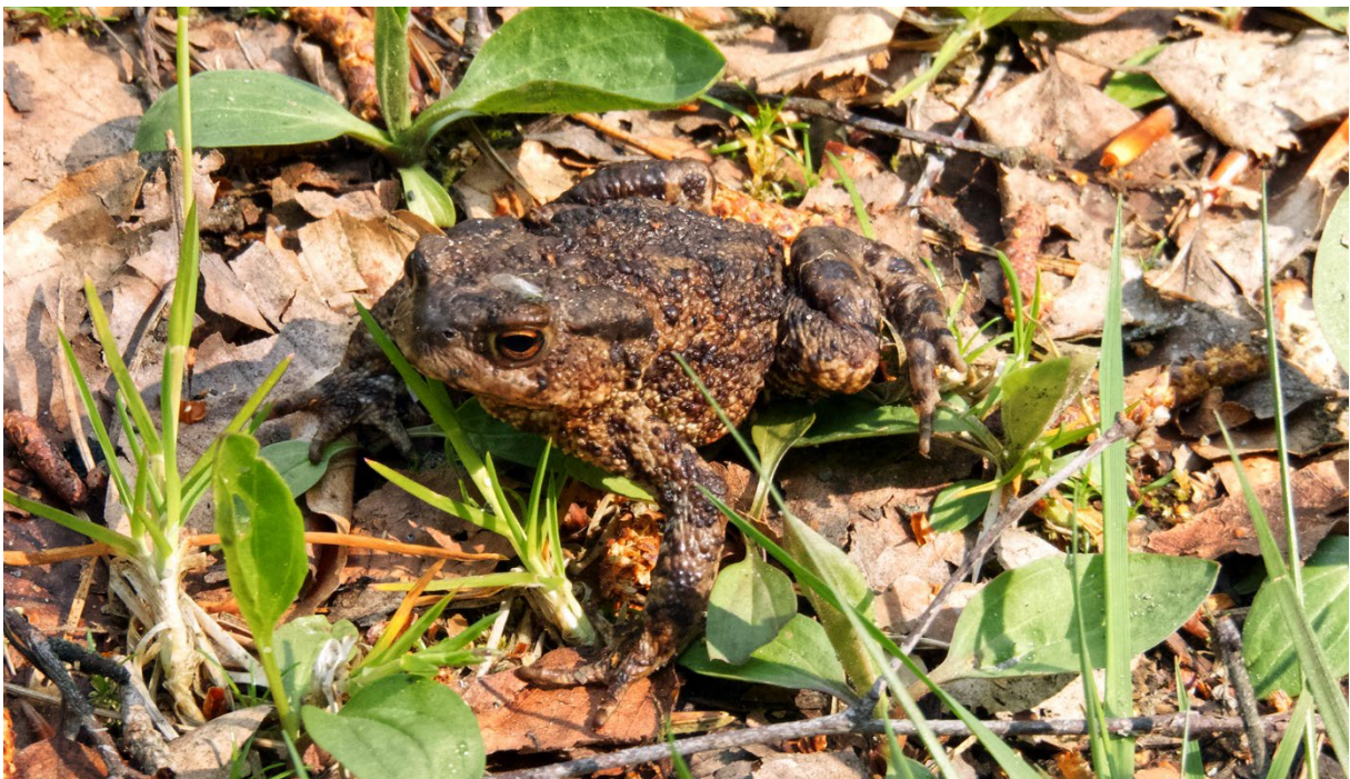
Vanlig padda, väster Bivackskogen, 24 maj. (Petter Gunnarsson)