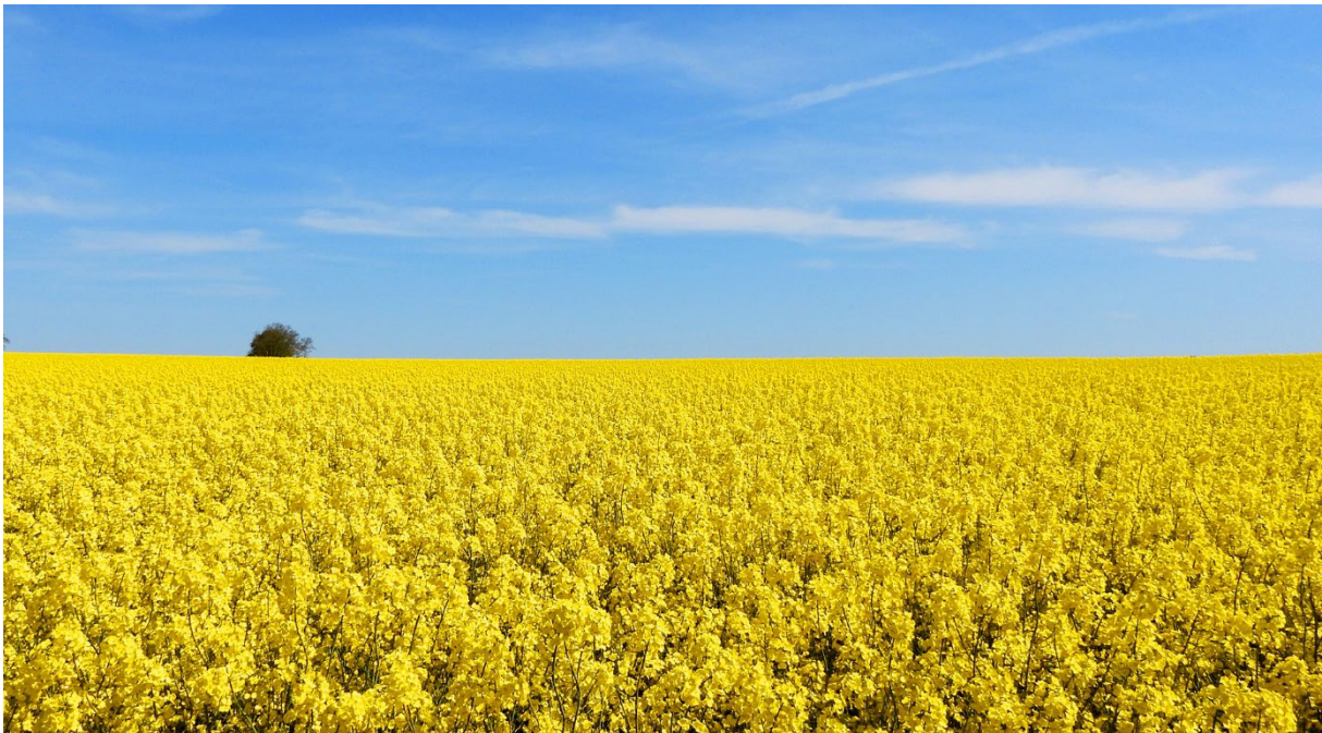
Rapsfält, 22 maj. (Petter Gunnarsson)