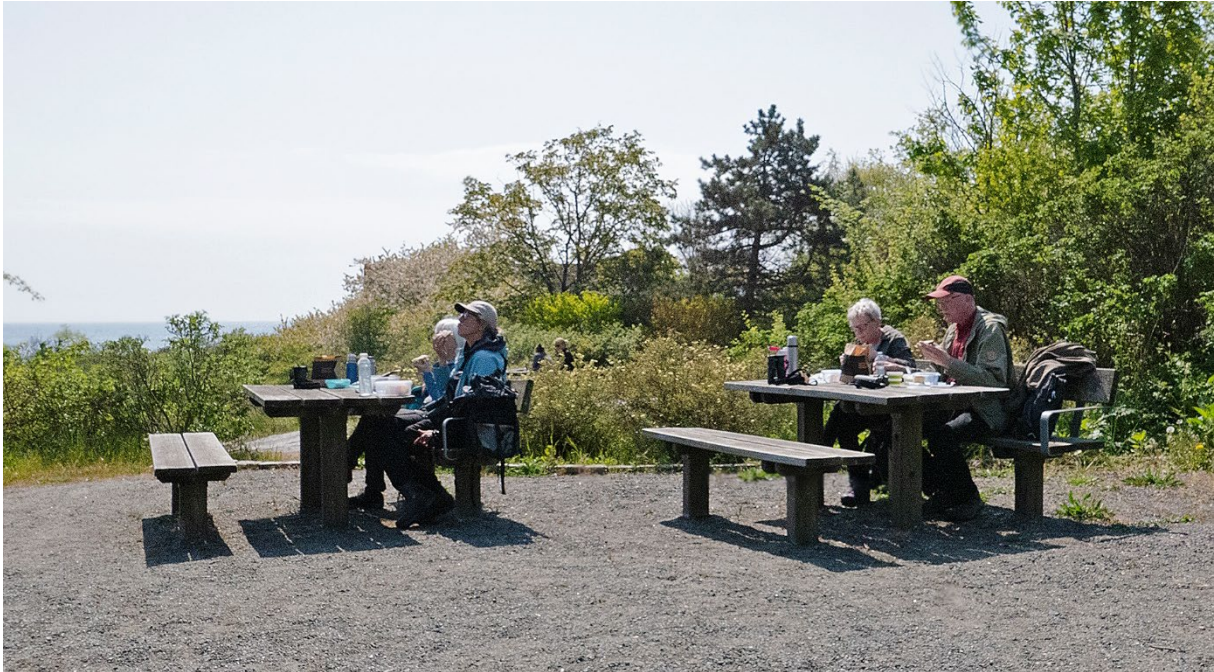
Civiliserad fältlunch vid bänkar och bord varje dag. Hällristningen, Simrislund, 24 maj. (Magnus Ullman)

Incheckning på Råkulle vandrarhem, Brantevik kl. 1700 efter att några deltagare avhämtats vid järnvägsstationen i Simrishamn.