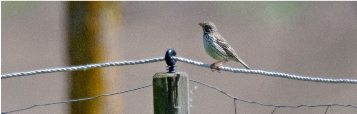
Kornsparv, Rännegatan, Peppinge, 25 maj. Vill inte komma riktigt nära. (Magnus Ullman)

Däremot ställer kornsparven vid Peppinge till det, och vi får ligga i rejält innan vi får någorlunda obsar av ett par. En av Sveriges sällsyntaste häckfåglar vill vi inte missa!