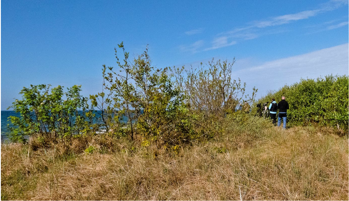
Vi hittar fint lä för sjöfågelspaning bakom några buskar vid Tygeåns mynning, 25 maj. (Magnus Ullman)

Blåsig idag, men vi hittar fint lä bakom några buskar vid Tygeåns mynning, riktigt skönt i solskenet. Även om det är rätt sent både på dagen och på säsongen får vi uppleva ett hyggligt sträck med flera fina siffror, inklusive 1 050 prutgäss på väg upp till den ryska ishavstundran. Dessutom vitkindad gås, ejder, småskrake, kustsnäppa och storlom. Sträckskådning är inte lätt – men kan vara kul!