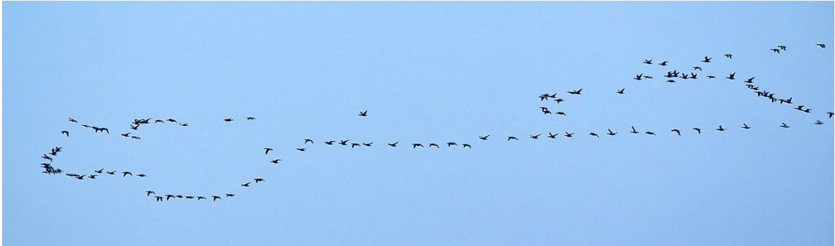
Många prutgäss. Och en ejder. Tygeåns mynning, 25 maj. (Magnus Ullman)