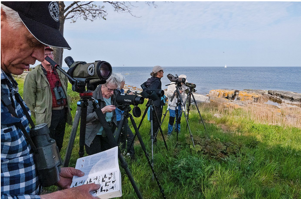
Sjörre eller inte sjörre?, det är frågan. Vejakåsen, 24 maj.

Vi har några minuter över och avslutar med sträckskådning vid Vejakåsen vilket ger några rastande ejdrar och d:o sjöorrar. Här står vi ett stenkast från vandrarhemmet, och var och en troppar av hemåt när det passar.